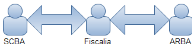
Figura 1. Partes intervinientes en el juicio digital

El siguiente diagrama muestra básicamente los elementos involucrados en este sistema. Los elementos son 3: ARBA, Fiscalía y SCBA. Cada elemento representa un sistema informático que modela el sistema administrativo de la organización. Luego, las flechas representan los canales de comunicación a través de webservices. Si bien la tecnología de webservices no es una novedad, lo novedoso de este proyecto es que se utilizan para transmitir títulos ejecutivos electrónicos firmados digitalmente que reemplazan a los emitidos en papel.