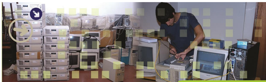
Fig. 1 - Trabajo en el Taller E-Basura

Como hemos mencionado anteriormente, las pruebas realizadas y la primer experiencia fue realizada en el marco del Proyecto E-Basura, en el que el proceso de higienización constituye una etapa importante del ciclo de recuperación y reutilización. Asegurar la protección de los datos de los donantes es primordial para que los mismos realicen una completa donación, sin tener que considerar que su información será manipulada. Por lo tanto, el proyecto busca informar a los usuarios y certificar el proceso de higienización con el fin de la obtención y no destrucción de los discos de almacenamiento para su correcta reutilización, ya que la probabilidad de conseguir discos viejos o modelos que ya no son fabricados es casi nula.