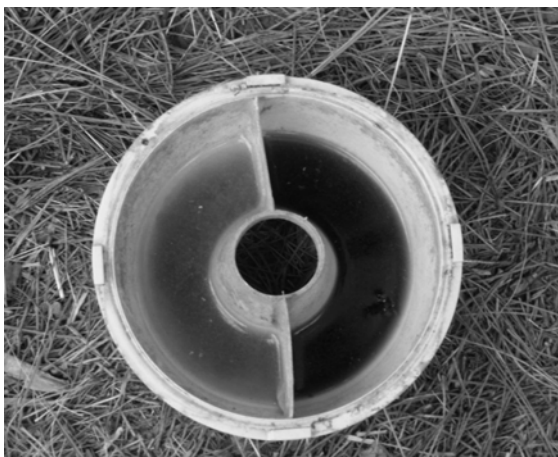
Figura 1. Vista interna de armadilha McPhail dividida por placas de acrílico contendo duas diferentes soluções de atrativos alimentares utilizados na captura

Proteína 5% + Suco de Goiaba integral 25%. As soluções compostas pelas substâncias atrativas e água foram colocadas em armadilhas McPhail no volume de 300 mL. Para os tratamentos quatro, cinco e seis, os frascos foram divididos por placas de acrílico, acopladas no interior do bojo (Figura 1), onde foram colocados 150 mL de cada atrativo. A troca dos atrativos foi realizada semanalmente e o monitoramento das armadilhas foi realizado diariamente. A cada avaliação contou-se o número de mosca-das-frutas capturadas as quais eram acondicionadas em álcool 70% para identificação através da utilização de chaves dicotômicas de identificação organizadas por Zucchi (2000). A sexagem dos indivíduos da mosca-da-fruta capturados nos diferentes tratamentos foi realizada no laboratório de entomologia da Estação Experimental de Fruticultura de Clima Temperado da Embrapa Uva e Vinho. Os valores de captura foram transformados em (raiz de x+0,5 ), e as médias foram comparadas pelo teste de Duncan ( p<0,05 ) através do programa SASM versão 8.2 (Canteri et al., 2001). A proporção sexual foi analisada através do teste qui-quadrado ( \chi^2 ) ao nível de 5% de probabilidade. Foram ajustadas regressões lineares do número médio de indivíduos capturados diariamente em cada atrativo com o objetivo de observar a sua eficiência de captura ao longo do tempo.