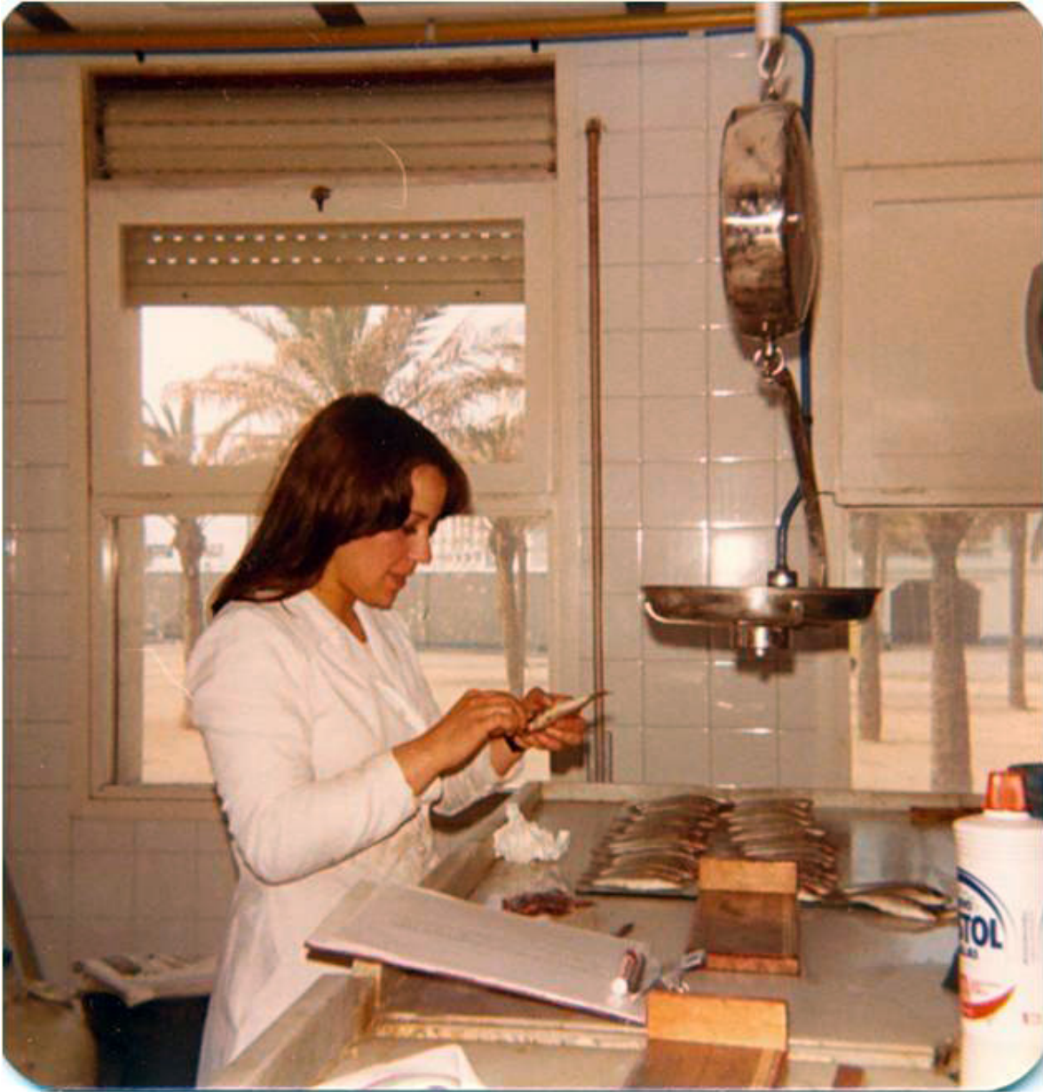
Laboratorio del Instituto de Investigaciones Pesqueras, Barcelona, España, 1978 Beca de Especialización Científica y Técnica del Instituto Español de Emigración