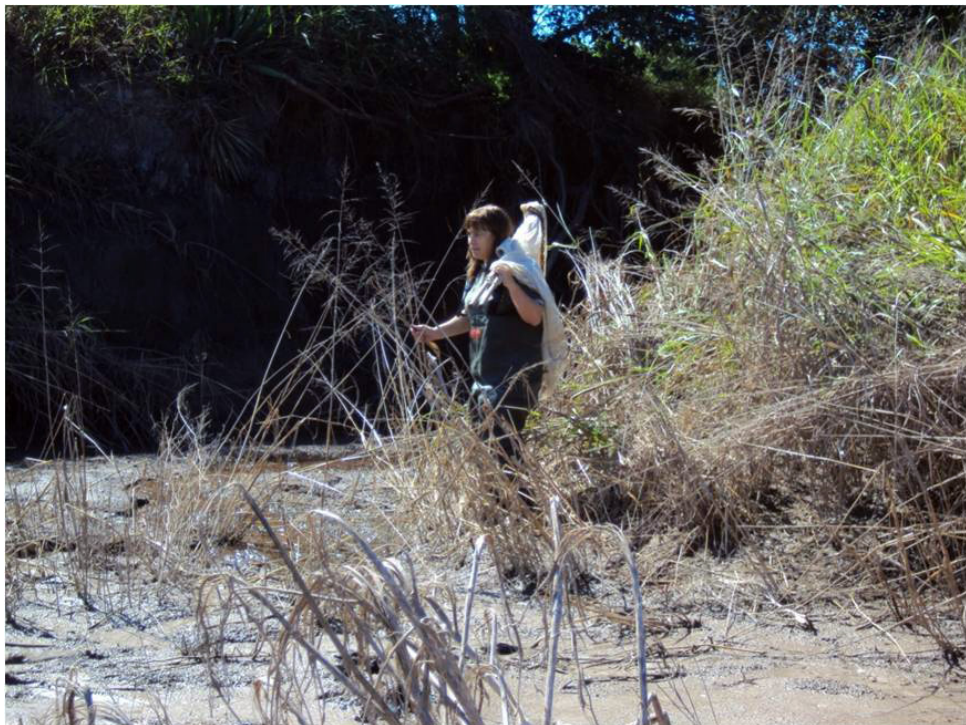
Bajando hacia el arroyo Saladillo con la red para peces, 2014