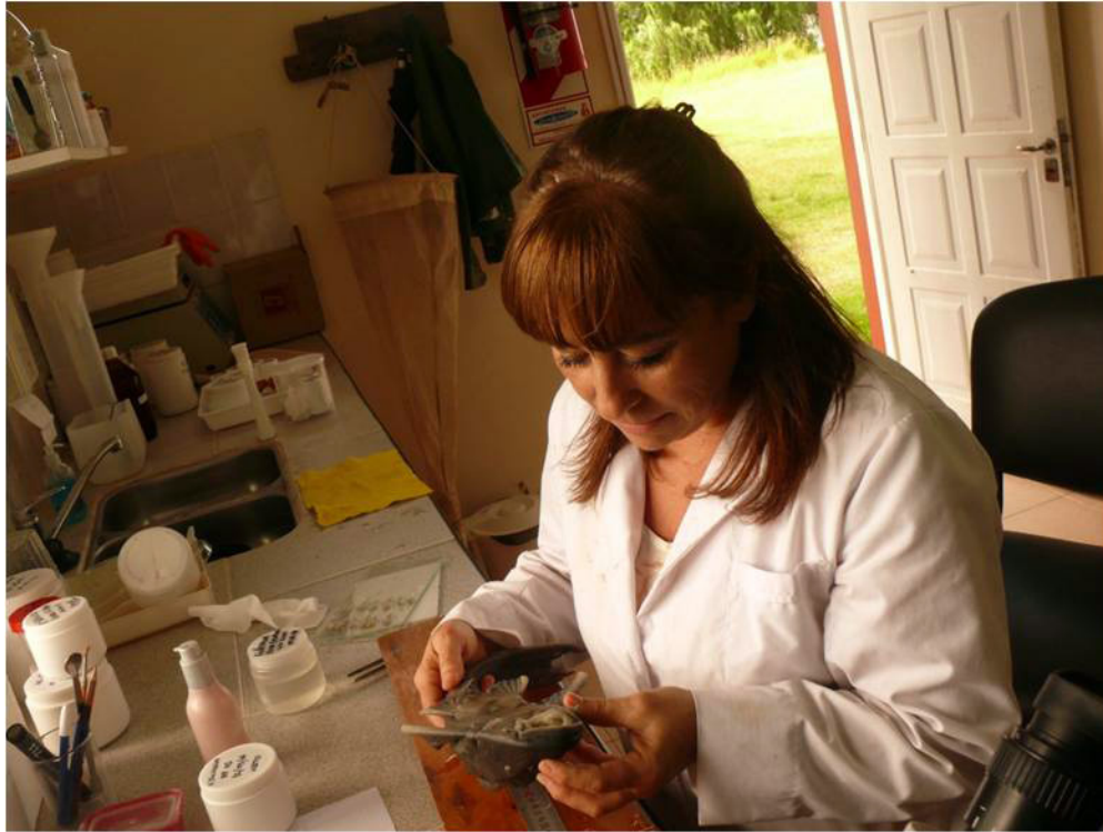
Laboratorio Sede Ribera, con uno de los peces capturados en el río Paraná, abril de 2014