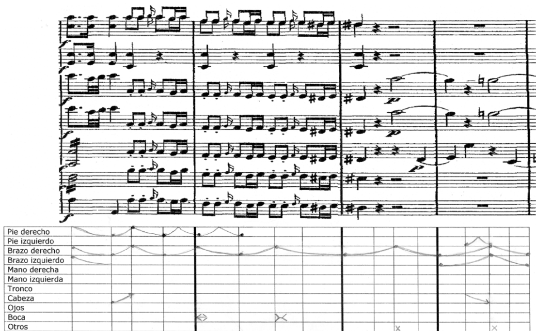
Figura 4: gráfico de las articulaciones corporales correspondientes a los compases 9 a 12

en sucesión, los que finalizan en el comienzo de la siguiente parte. Las articulaciones de este pasaje se muestran en la figura 4.