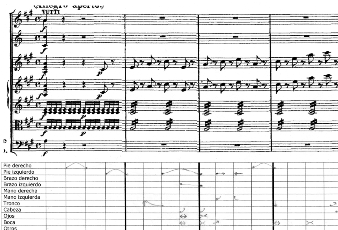
Figura 2: Gráfico de las articulaciones corporales correspondientes a los 4 primeros compases del fragmento. Los extremos, el contorno y la longitud de las trayectorias de las flechas indican, respectivamente, los lugares métricos de inicio y finalización del movimiento, el uso del plano espacial y la duración del movimiento en número de unidades métricas. En el último tactus del compás 2 y primero del compás 3 puede advertirse el uso de movimientos de cabeza, ojos y boca que señalan la repetición variada del motivo inicial en comienzo anacrúsico.

Si bien estos movimientos podrían ser considerados ajenos a la géstica propia del análisis métrico, sin embargo denotan sincronía con las jerarquías métricas que el sujeto parece estar configurando. En este sector, el punto de mayor densidad de movimiento se produce hacia el final del 2do compás, cuando comienza la repetición del diseño melódico inicial. En el último tactus del compás 2 y el primero del compás 3, puede observarse el uso de movimientos de cabeza, ojos y boca que señalan dicha repetición y dan cuenta de la ‘saliencia perceptiva’ del comienzo anacrúsico.