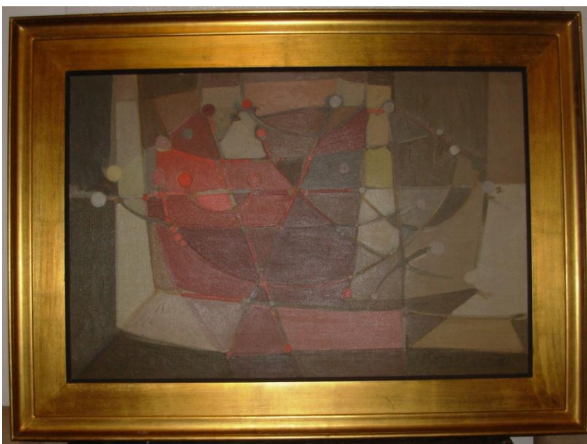
De la serie Poliedro.