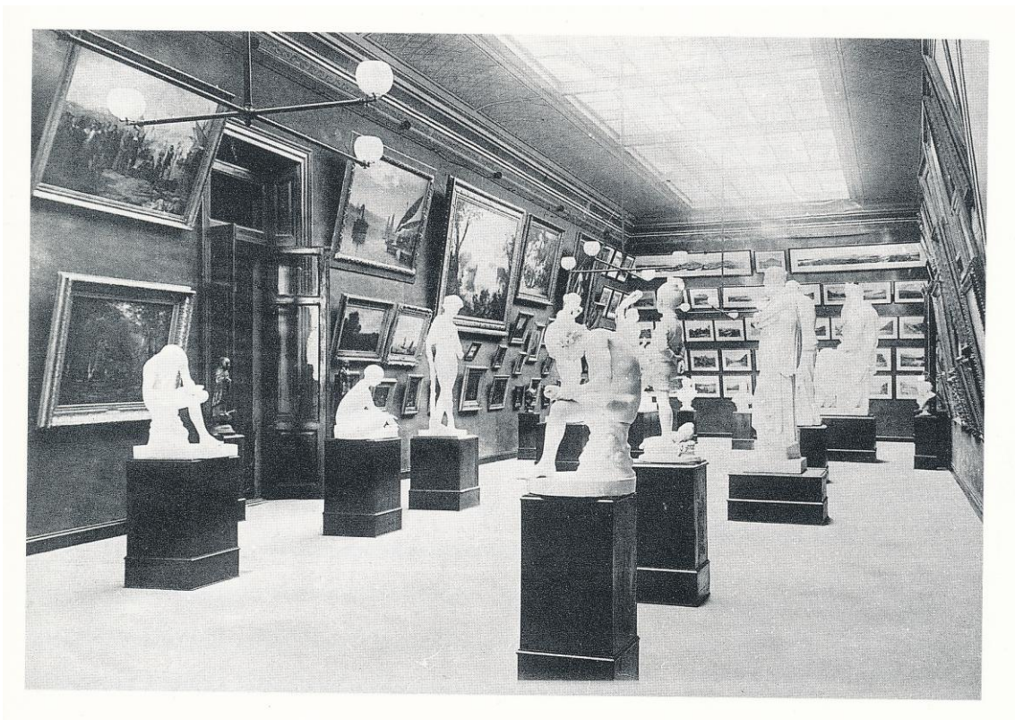
Sala de Calcos en museo de Ciencias Naturales de la Plata, década del '80.