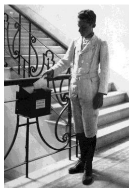
En el descanso de la escalera del Colegio Nacional se colocó un buzón para que los alumnos dejen sugerencias y donaciones.