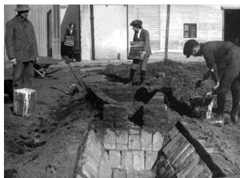
Los alumnos construyen una pileta para apagar la cal viva.