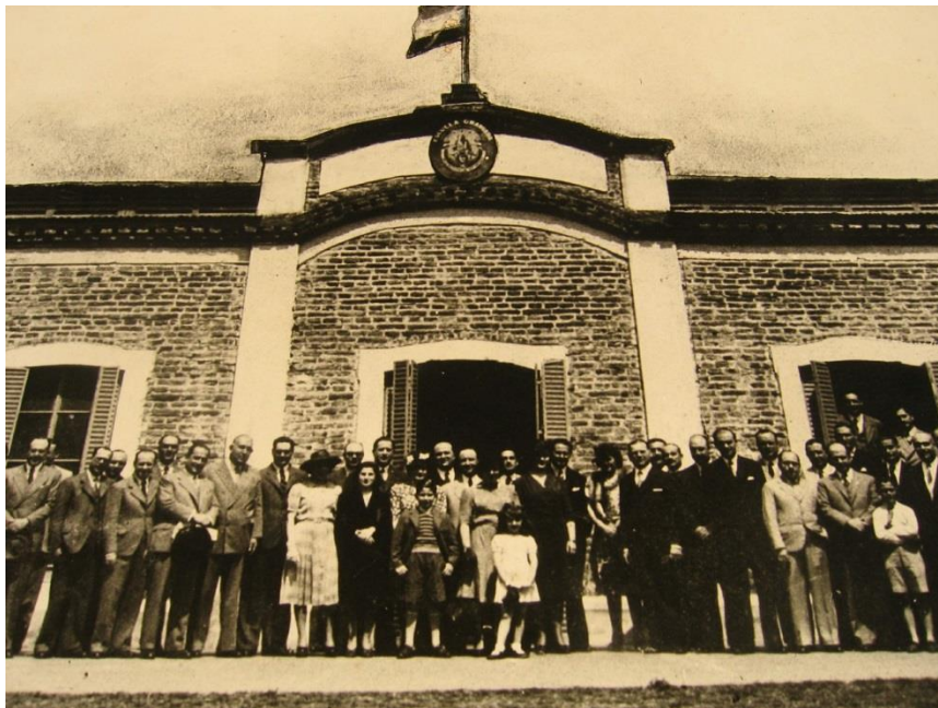
25° aniversario de la construcción del Aula-Taller (1942)

Finalmente, retomadas las clases, en 1920 se realizó la clásica ceremonia del techado de la obra, en la cual se colocó en los parantes hojas de roble, emblema de la UNLP. A la ceremonia asistieron el nuevo director Dr. Luis Pelliza, los maestros y todos los alumnos. El proyecto se terminó en 1924 y en el aula-taller funcionaron todos los talleres.