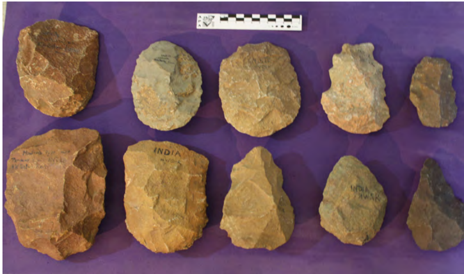
Colección Setton-Karr, procedente de India

Las tareas de archivo antes detalladas posibilitaron el referenciamiento de colecciones que de otro modo permanecerían hoy sin una clara identificación. La falta de identificación o la imposibilidad de conectar el material con su información pertinente por el motivo que fuere, implicaría la pérdida de identidad de esas piezas, convirtiéndolas en un simple objeto de colección o en un mero ejemplo tipológico, sin adscripción a un tiempo y espacio determinados (Arena 2006-2007)