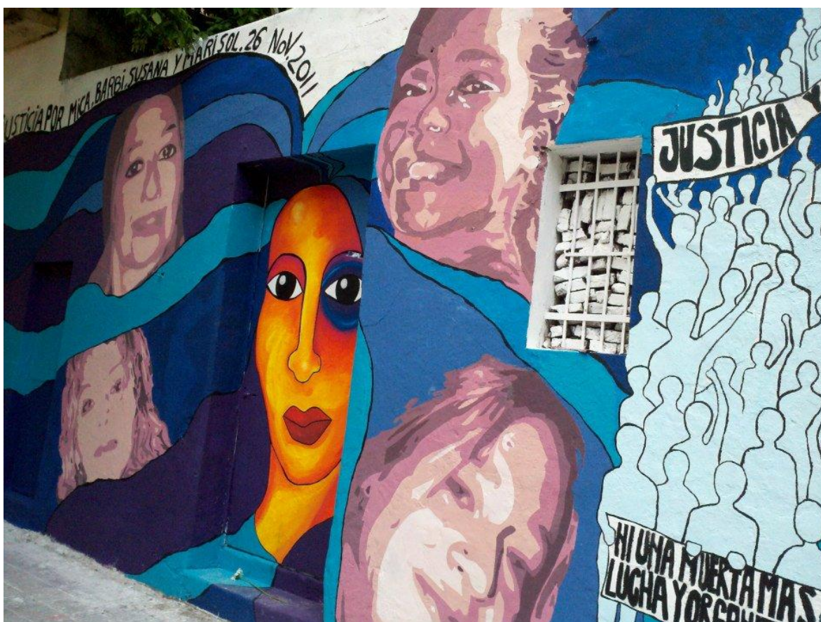
Plaza Paso 44 y 13, Muro - ex casa de EDELAP

Los colectivos de artistas durante el siglo XXI han priorizado un trabajo mancomunado con el fin de constituir una esfera pública paralela que destaque tanto la defensa sobre los derechos humanos como de género.