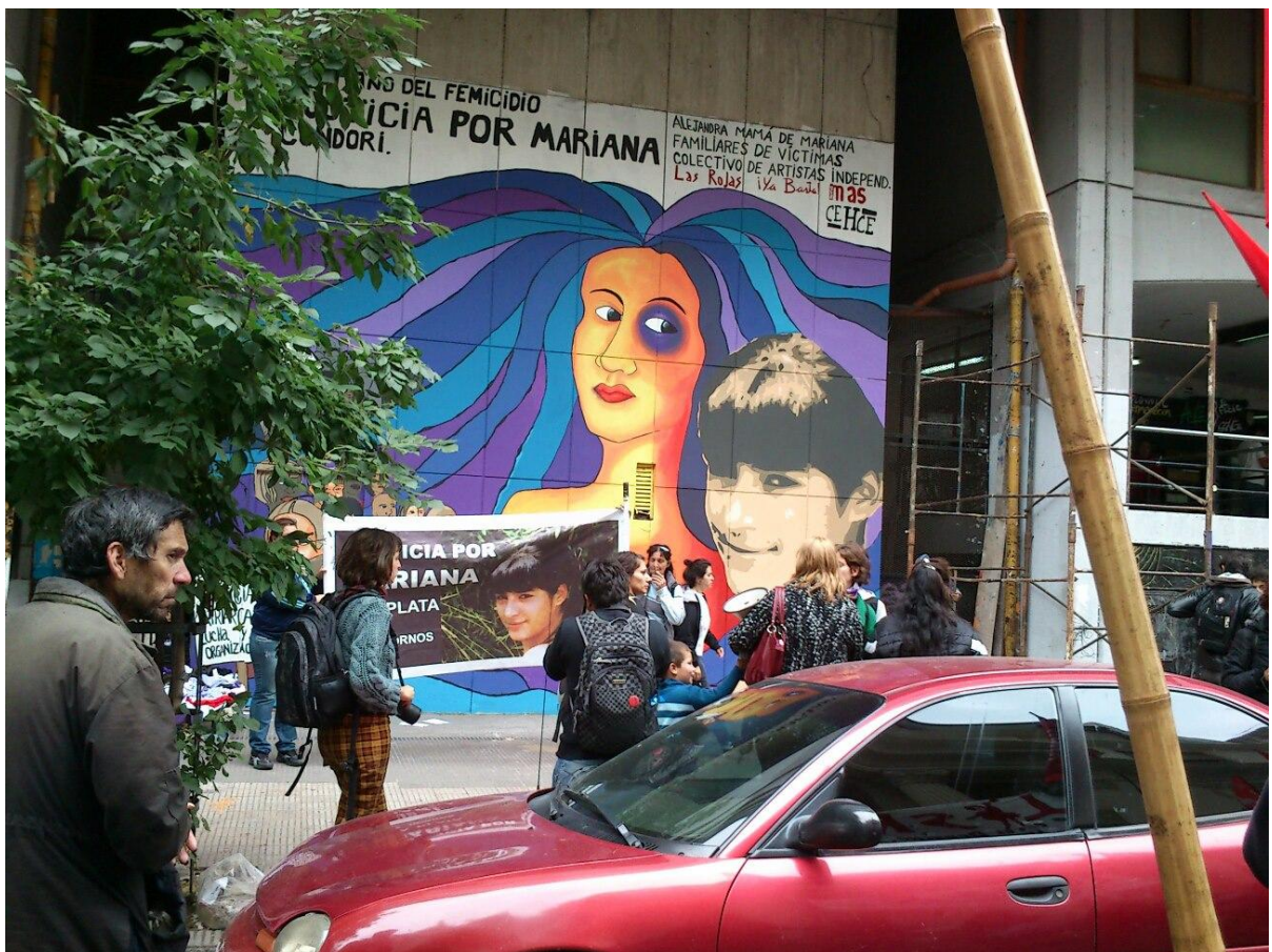
Fachada de la Facultad de Humanidades y Ciencias de la Educación, Calle 48 entre 6 y 7. La Plata

representante de la figura femenina latinoamericana, de largos cabellos separados en bandas de colores de donde surgen los rostros de las víctimas que se reconocen por su similitud con las fotos publicadas en medios gráficos. En el caso del mural de Mariana Condori surgen numerosos rostros anónimos y las consignas se hallan en la parte superior de la imagen, en una banda separada de la imagen por su fondo blanco, donde se repite el slogan: "JUSTICIA POR MARIANA". Se encuentran en esta cartela una serie de nombres que aluden a la familia de la víctima y a la agrupación Las Rojas , mientras que en el mural del cuádruple homicidio son siluetas – sin rostros – las que sostienen un cartel con las consignas " Ni una muerta más. Lucha y organización " " Basta de Justicia Patriarcal " siendo esta última, una de las consignas que comparten ambos murales. Lo interesante sobre el rostro de Mariana Condori que este se basa en una fotografía que luego se ha ampliado y forma parte de un afiche de campaña y de estenciles que se han volcado en las paredes en la lucha por su caso.