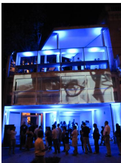
1- Registro fotográfico de la proyección realizada en la fachada de la casa Curuchet.

Estamos frente a una tipología de obra de escala mayor de lo real, que oscila entre lo racional y lo irracional, tratando de usar tecnología de avanzada y generar producciones sensibles, y cuyos antecedentes más inmediatos son el videoarte, las instalaciones, y las videoinstalaciones.