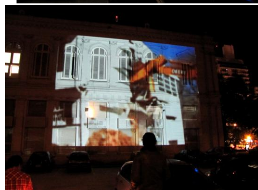
3 y 4- Registro fotográfico de la proyección realizada en la fachada del Rectorado.