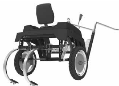
Vista del producto

Se arribó a un producto que busca dar respuesta a las necesidades del usuario, sin perder de vista la adecuación al medio. Entendemos que este producto aún la morfología y las características propias del equino con una tecnología a todas luces económica y eficiente. Y este ensamble posibilitará, en un futuro no muy lejano, obtener grandes réditos utilizando bajos recursos.