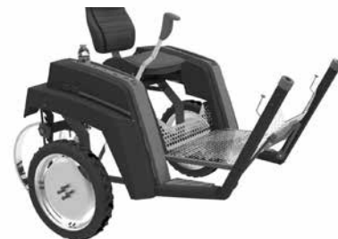
Conjunto sin las varas. Vista del producto y de la zona de operación que contiene al usuario

Se arribó a un producto que busca dar respuesta a las necesidades del usuario, sin perder de vista la adecuación al medio. Entendemos que este producto aún la morfología y las características propias del equino con una tecnología a todas luces económica y eficiente. Y este ensamble posibilitará, en un futuro no muy lejano, obtener grandes réditos utilizando bajos recursos.