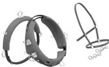
Partes que componen el conjunto armado del apero

Por último, se diseñó un sistema de sujeción del caballo denominado collarón , que está realizado mediante una volumetría que busca generar una zona de circulación de aire para que la transpiración del equino y el esfuerzo no lo lastimen, pero que, al mismo tiempo, contemple la mayor zona de apoyo.