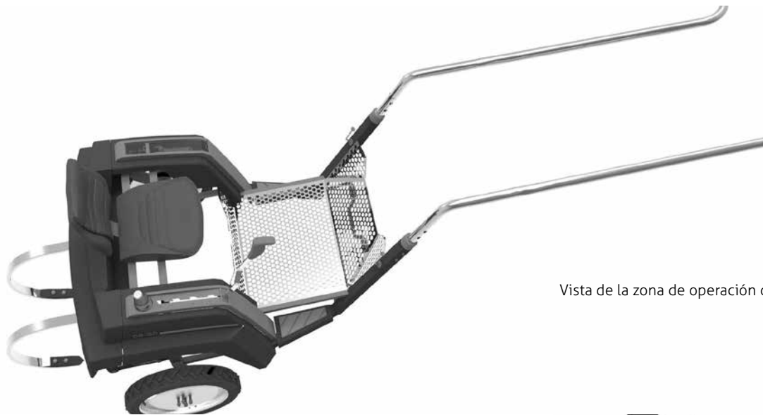
Vista de la zona de operación de usuario

con materiales no resbaladizos. Toda la máquina tiene una altura pensada para poder pasar sobre los surcos y un ancho de trocha óptimo, que le permite transitar entre ellos. Para esto, se utilizaron rodados livianos de gran diámetro. Es necesario que el producto final cuente con estas medidas para que se mantenga de manera estable frente a un suelo irregular. Las varas cuentan con un sistema de vínculo que permite regular las distintas alturas del equino.