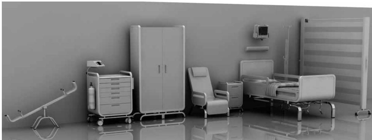
Conjunto de componentes

El trabajo consiste en una familia de productos mobiliarios que integran una unidad hospitalaria de pediatría. En esta unidad se atiende a los lactantes y a los niños de los siguientes grupos etarios: preescolares, escolares y adolescentes. Para realizar los productos se tomaron como usuarios principales a los preescolares (1 a 6 años) y a los escolares (6 a 14 años).