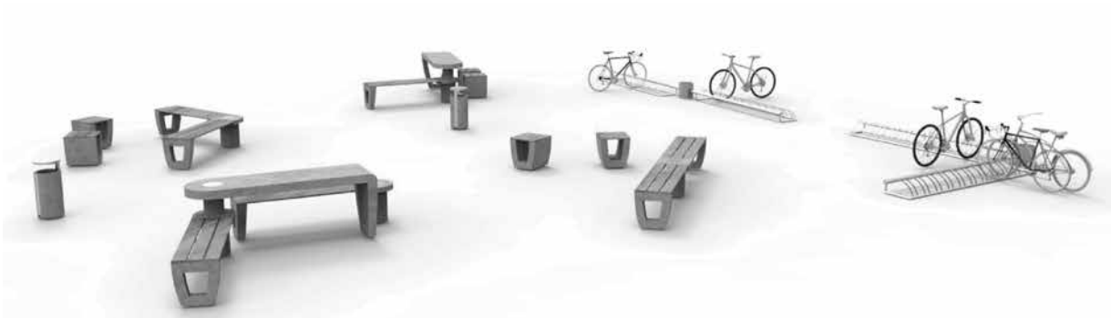
Equipamiento del grupo GÜD