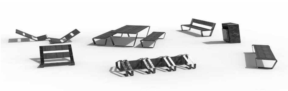
Equipamiento del grupo NS/NC