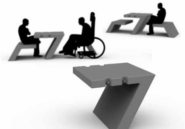
Mesa, asiento y bicicletero diseñados por el grupo Carancho