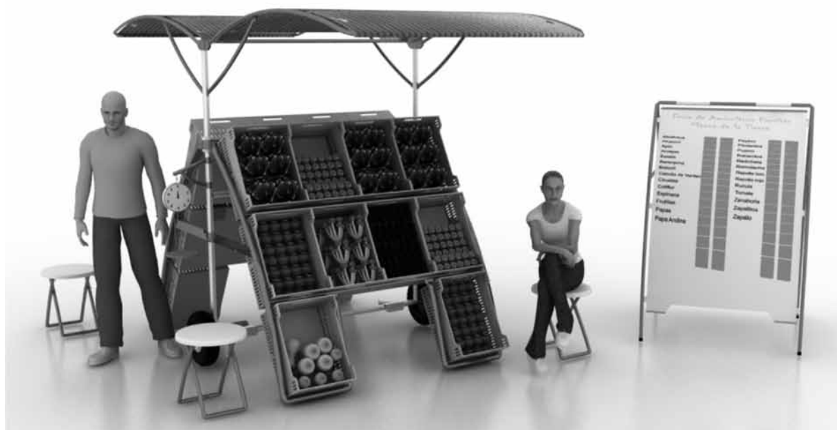
Situación de uso

El siguiente puesto fue diseñado para los pequeños productores de la agricultura familiar, en el marco de un trabajo interactivo desarrollado entre la Cátedra A y el INTA-IPAF Región Pampeana.