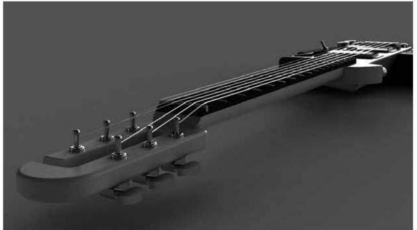
Mástil de guitarra