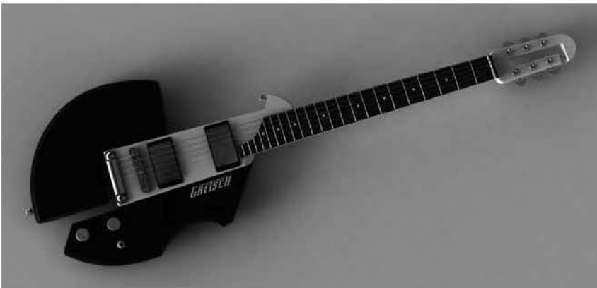
Vista de la guitarra