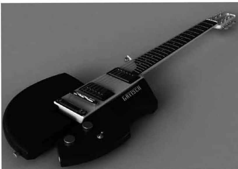
Meta de la guitarra

Como concepto para el desarrollo del trabajo se buscó contraponer estos dos momentos que conviven en la actualidad. Por un lado está la estética del pasado, caracterizada por ser refinada, clásica y europea. Por el otro, la actitud de rebeldía y agresión que representa