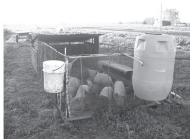
FIGURA 1. Antecedentes