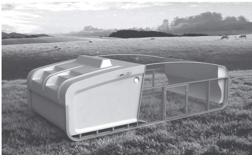
FIGURA 2. Perspectiva Implantada