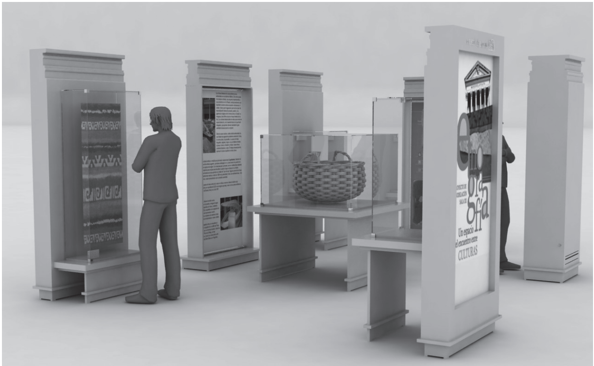
FIGURA 1. Perspectiva del conjunto

Para diseñar el proyecto se respetó la identidad del Museo de Ciencias Naturales de La Plata, con el fin de que el stand para muestras itinerantes permita generar la sensación que causa estar en dicho establecimiento.