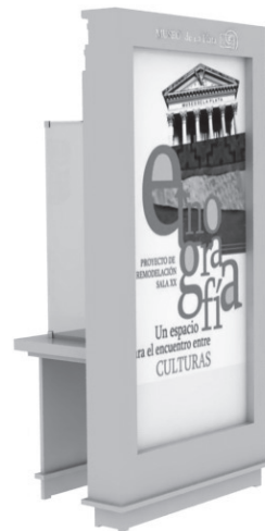
FIGURA 4. Detalle exhibidor parte exterior