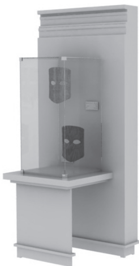
FIGURA 3. Detalle exhibidor parte interior