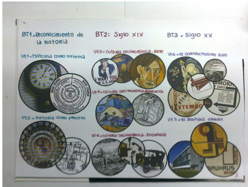
Gráfico conceptual del Programa de la Materia

En las prácticas del año, en los siguientes dos trimestres, el alumno aborda con la misma metodología los otros dos bloques temáticos de la cultura material del siglo XIX y de las primeras tres décadas del siglo XX. Allí analiza antecedentes de objetos industriales y artesanales del siglo XIX y posteriormente, objetos de diseño de las escuelas alemana (Bauhaus) y rusa (Vkhutemas) en su contexto.