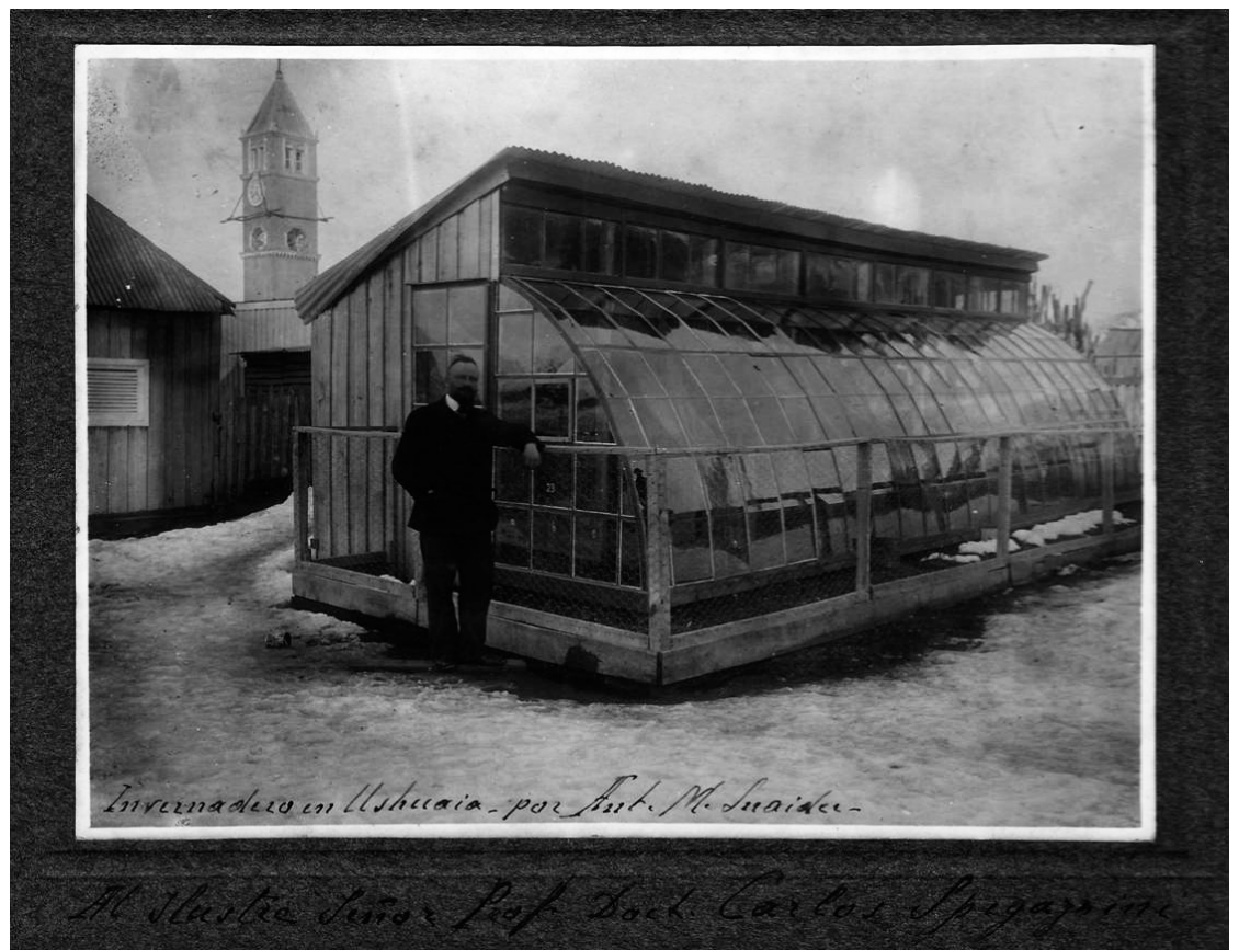
Invernadero en Ushuaia