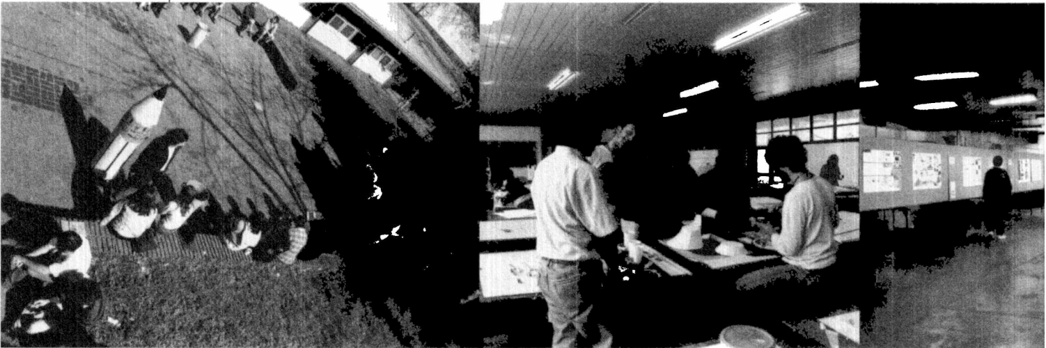
Exposición de fotografías: " Muestra fotográfica de la Universidad Nacional de La Plata "