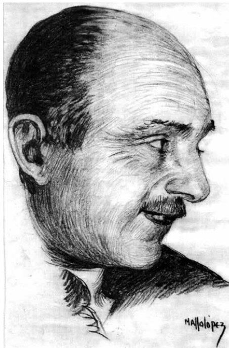
Ilustración de Consuelo Mallo López

http://www.ciweb.com.ar/siccardi/index.php