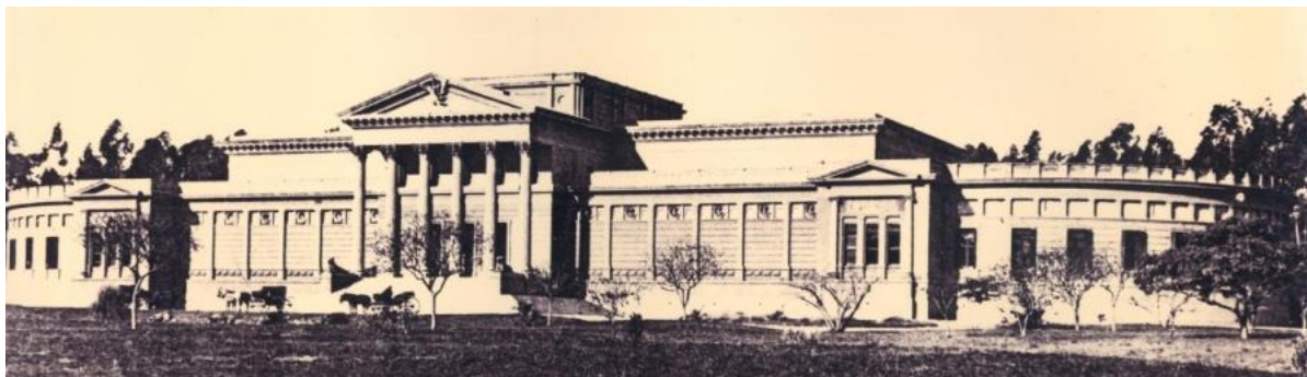
Fotografía 1. Vista general del Edificio del MLP (circa 1890)