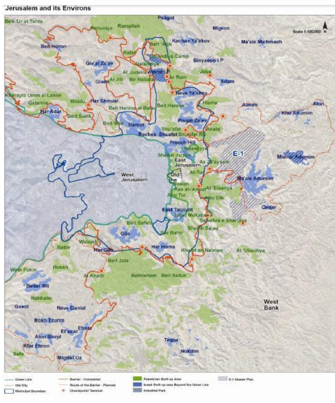
Mapa N° 2. Área extendida de la región metropolitana de Jerusalén 15 .

control y comisarías policiales, en el seno de los territorios palestinos 14 . Si echamos una mirada al siguiente mapa extendido de la región metropolitana de Jerusalén, veremos cómo estos planes de intervención sobre el espacio urbano de Jerusalén Este se articulan con la implantación de colonias, puestos de control y pasos fronterizos, estaciones policíacas, parques industriales, lo que entenderemos como algunas de las principales tecnologías de gobierno implementadas en términos de presencia física, residencial e institucional, detrás del muro que divide Israel de Cisjordania.