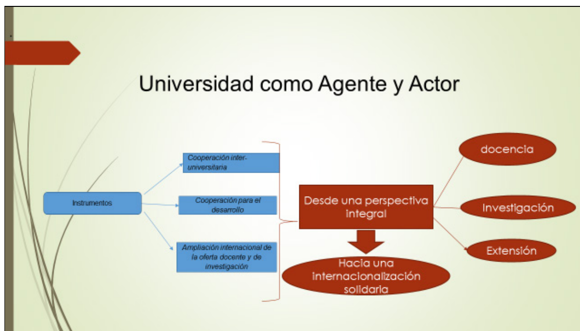
Figura II: la Universidad como agente y actor de internacionalización