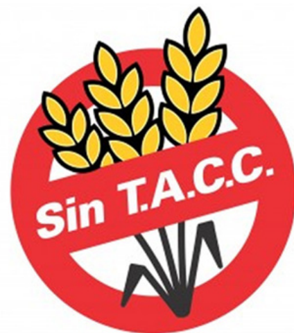
Figura 1: Logo Oficial para alimentos libres de gluten de la República Argentina.

y se incorporó la metodología analítica basada en la Norma CODEX STAN 118-79 (23) y toda aquella que la Autoridad Sanitaria Nacional avale. El INAL adoptó como método oficial la prueba RIDASCREEN® Gliadin (R-Biopharm AG) con un límite de detección de 1,5 ppm de gliadinas (3 ppm gluten) y un límite de cuantificación de 2,5 ppm de gliadinas (5 ppm de gluten), reconocida como método oficial por la AOAC (Association of Official Analytical Chemists) (5, 37). En la provincia de Buenos Aires, la técnica del Dr. Chirido (Universidad Nacional de La Plata), con sensibilidad de 1 ppm de gliadina en sustancia seca, fue aprobada por Resolución 4370/2000 del Ministerio de Salud de la Provincia de Buenos Aires (34). En el Acta 90/2011 de CONAL (35) se estableció una modificación del símbolo obligatorio, de manera que la leyenda “Sin TACC” aparece sobre un círculo rojo con una espiga amarilla (Fig. 1). También se acepta que el símbolo aparezca en blanco y negro. Dicho símbolo es de uso obligatorio para alimentos libres de gluten según el Art. 1383 bis del CAA (36).