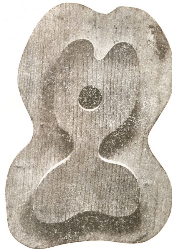
TORSO Y OMBLIGO . relieve en madera (1918)