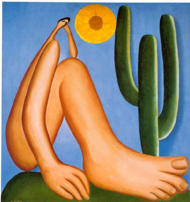
“Abaporu”. Tarsila do Amaral, 1928, Museo de Arte Latinoamericano de Buenos Aires, Argentina.