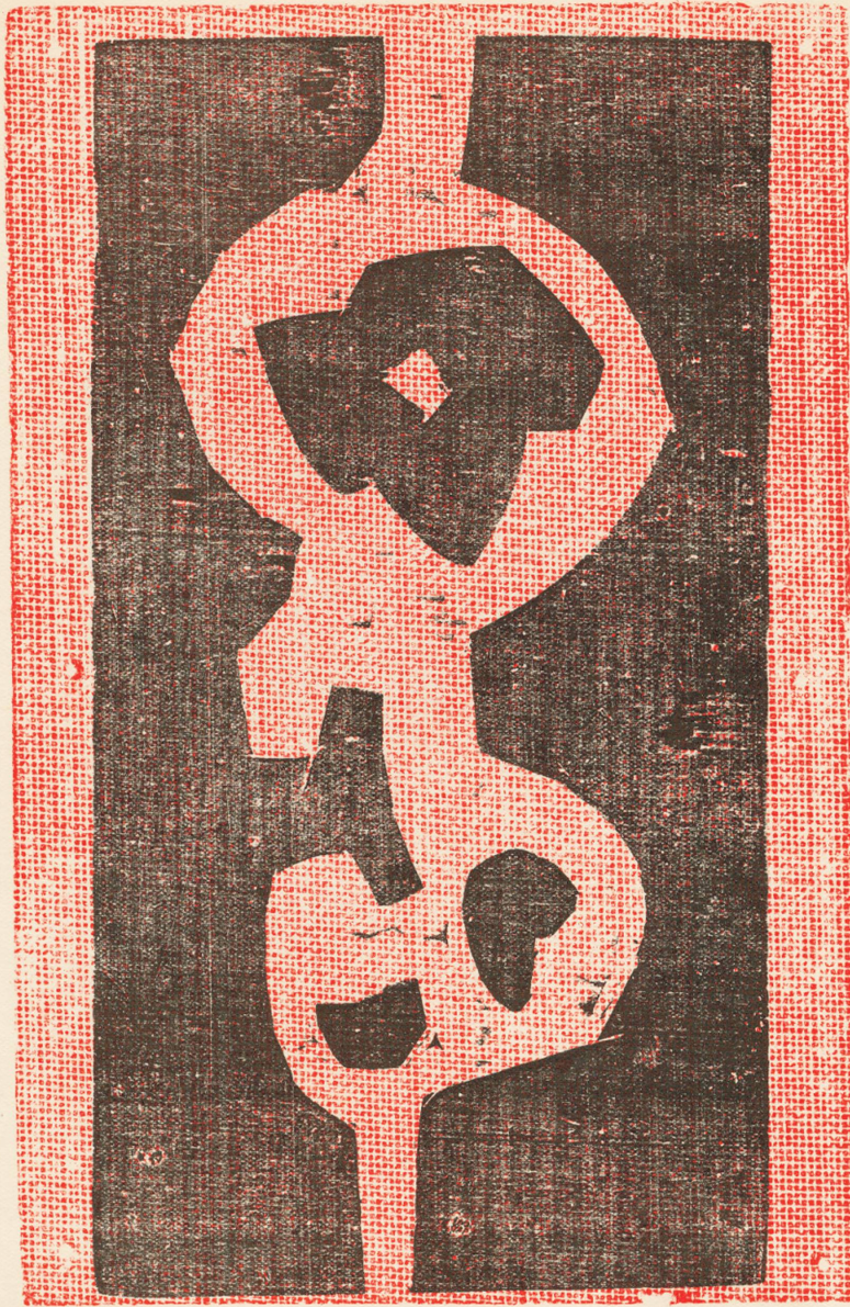
FORMA - xilografia