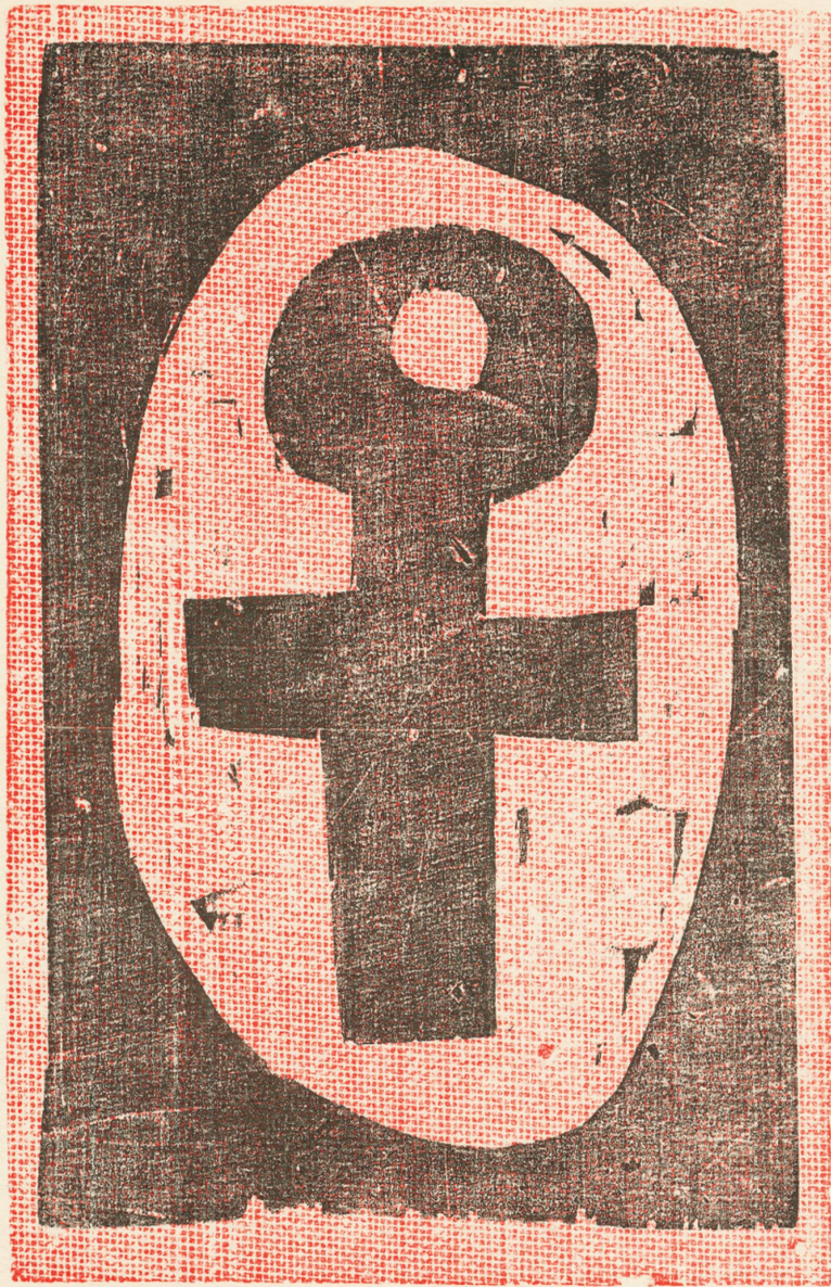
SIGNO - xilografia