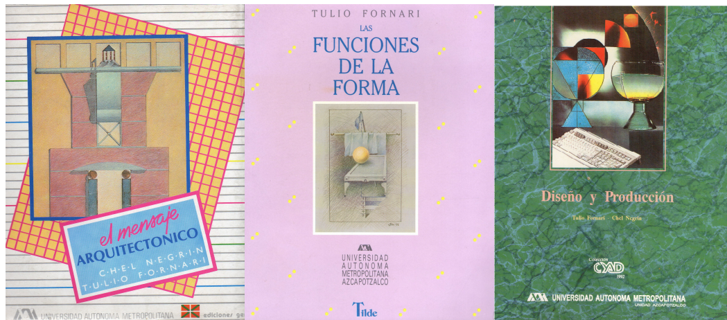
El Mensaje Arquitectónico , 1987; Las Funciones de la Forma , 1989; Diseño y Producción , 1992