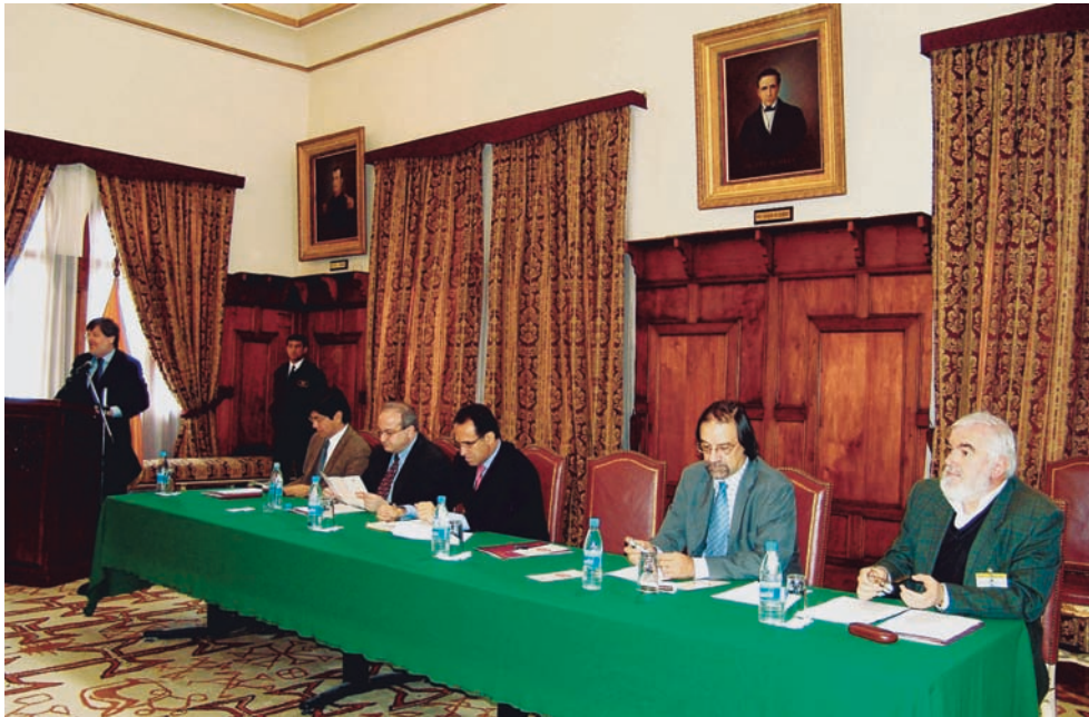
Inauguración del Quinto Seminario del PLANEX 2020, en la ciudad de Quito, con la presencia del ministro de Relaciones Exteriores, Francisco Carrión Mena, el prefecto de Pichincha, Ramiro González, y otras personalidades.