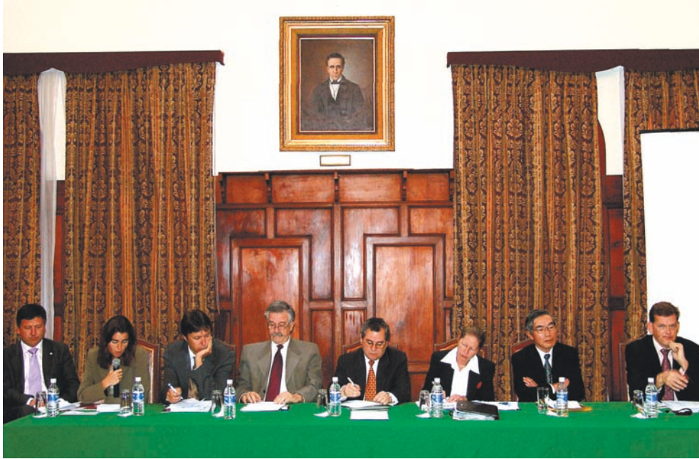
Sesión II: La cooperación bilateral. Mesa Redonda: representantes de la cooperación de Alemania, Bélgica, España, Estados Unidos, Japón, Suiza.