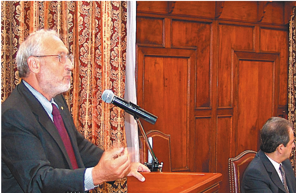
Sesión I: El Ecuador en el escenario global. “Los retos de la globalización para los países en desarrollo”. Joseph Stiglitz, premio Nobel de Economía 2001.