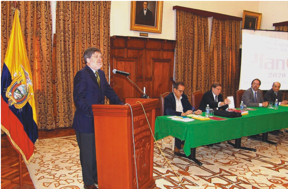
Inauguración del Décimo Segundo Seminario del PLANEX 2020, en la ciudad de Quito, con la intervención del ministro de Relaciones Exteriores, embajador Francisco Carrión Mena .