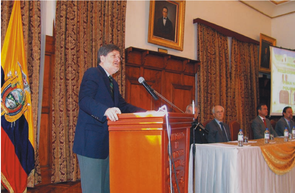
Inauguración del Décimo Seminario del PLANEX 2020, en la ciudad de Quito, con la intervención del ministro de Relaciones Exteriores, embajador Francisco Carrión Mena.