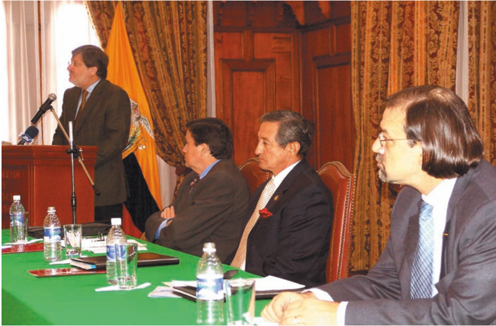
Inauguración del Sexto Seminario del PLANEX 2020, en la ciudad de Quito, con la presencia del ministro de Relaciones Exteriores, embajador Francisco Carrión Mena.