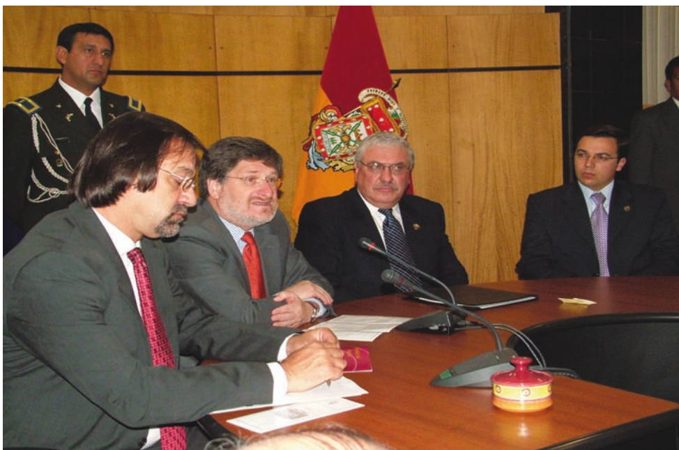
Inauguración del Tercer Seminario del PLANEX 2020, en la ciudad de Cuenca, con la presencia del ministro de Relaciones Exteriores, Francisco Carrión Mena, el alcalde Marcelo Cabrera Palacios y otras autoridades, el 9 de enero de 2006.