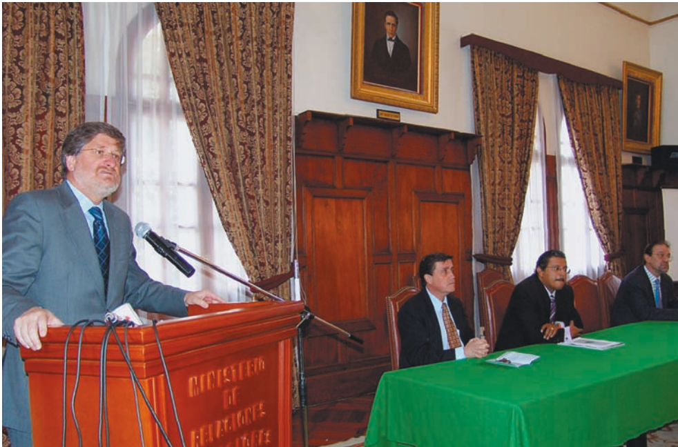
Inauguración del Noveno Seminario del PLANEX 2020, en la ciudad de Quito, con la intervención del ministro de Relaciones Exteriores, embajador Francisco Carrión Mena.