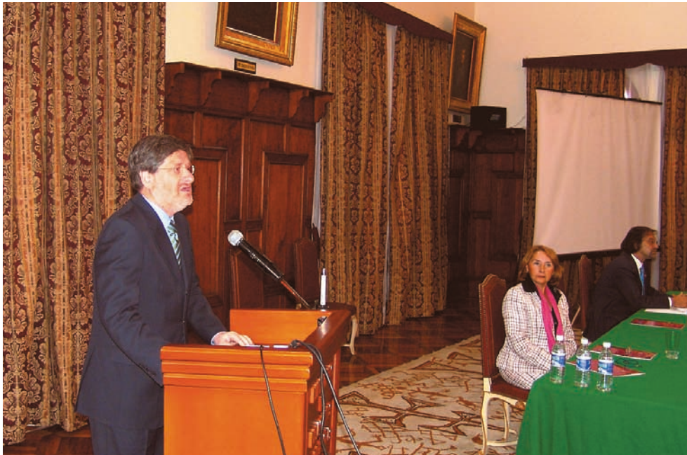
Inauguración del Séptimo Seminario del PLANEX 2020, en Quito, con la presencia del ministro de Relaciones Exteriores, Francisco Carrión Mena, y la subsecretaria de Cultura, Beatriz Parra.