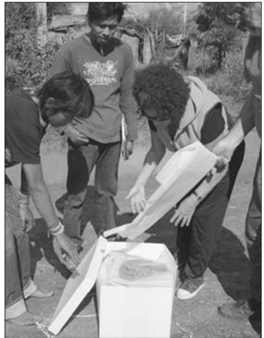
Fig. 2. Entrega de los restos recuperados a la Familia Hilario.

Las escasas investigaciones bioarqueológicas sistemáticas así como una mala preservación de los restos debido a las condiciones ambientales, han conspirado a lo largo del tiempo para que el registro bioarqueológico en el Gran Chaco sea limitado (Desántolo et al., 2012b). Por tanto, el hallazgo en “El Quebracho” constituye un hecho representativo de acciones inhumatorias registradas en un espacio delimitado, con entierros primarios múltiples y materiales culturales asociados espacialmente. Pobladores testigos de este hallazgo, conscientes de su significado como medio explicativo de sus orígenes, encabezaron una acción movilizadora, proteccionista, de resguardo del dato arqueológico proponiendo a partir de la colaboración de los entes estatales involucrados (Ministerio de Gobierno y Dirección de Patrimonio de la Provincia de Formosa) una arqueología de rescate que pudiese exhumar los restos detectados