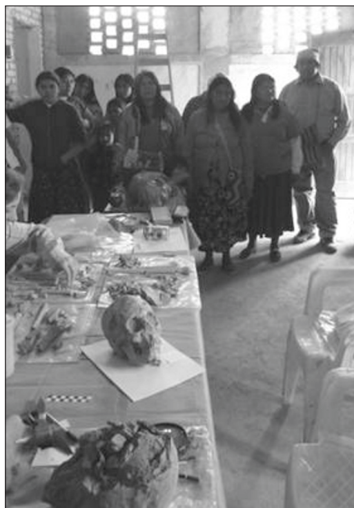
Fig.5. Laboratorio de campaña, Septiembre 2011.

Probablemente proyectos de investigación integrados bioculturalmente, como el que nos ha convocado en el Chaco Meridional donde la