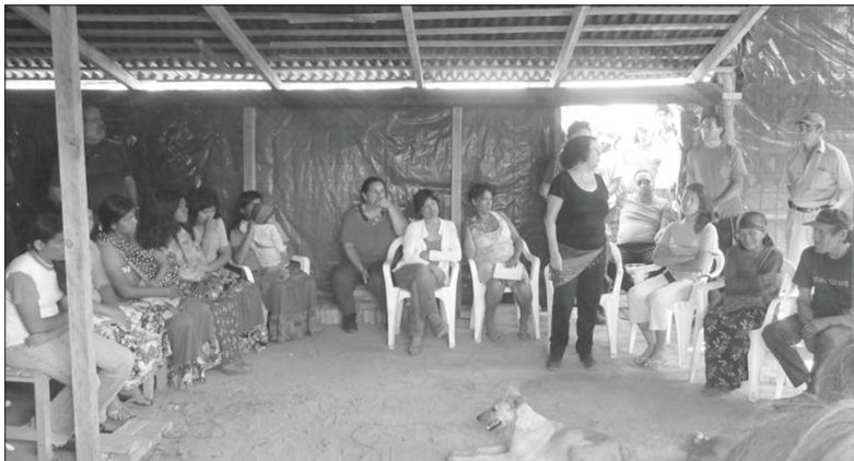
Fig. 3. Comunidad El Quebracho. Asamblea aborígen.