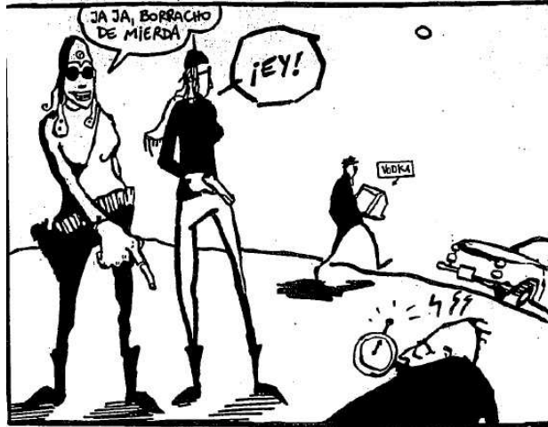
(Viñeta en 2005: 23)

podríamos afirmar que al menos este cuadrito no responde a lo que conocemos como realista: los trazos no responden ni a la ubicación geográfica ni a una representación "real" de los personajes. En la viñeta siguiente, el dibujo de los cuerpos responde a las dimensiones de cercanía y lejanía, de una mirada que se mantiene por encima del escenario de los acontecimientos pero en los alrededores, atenta.