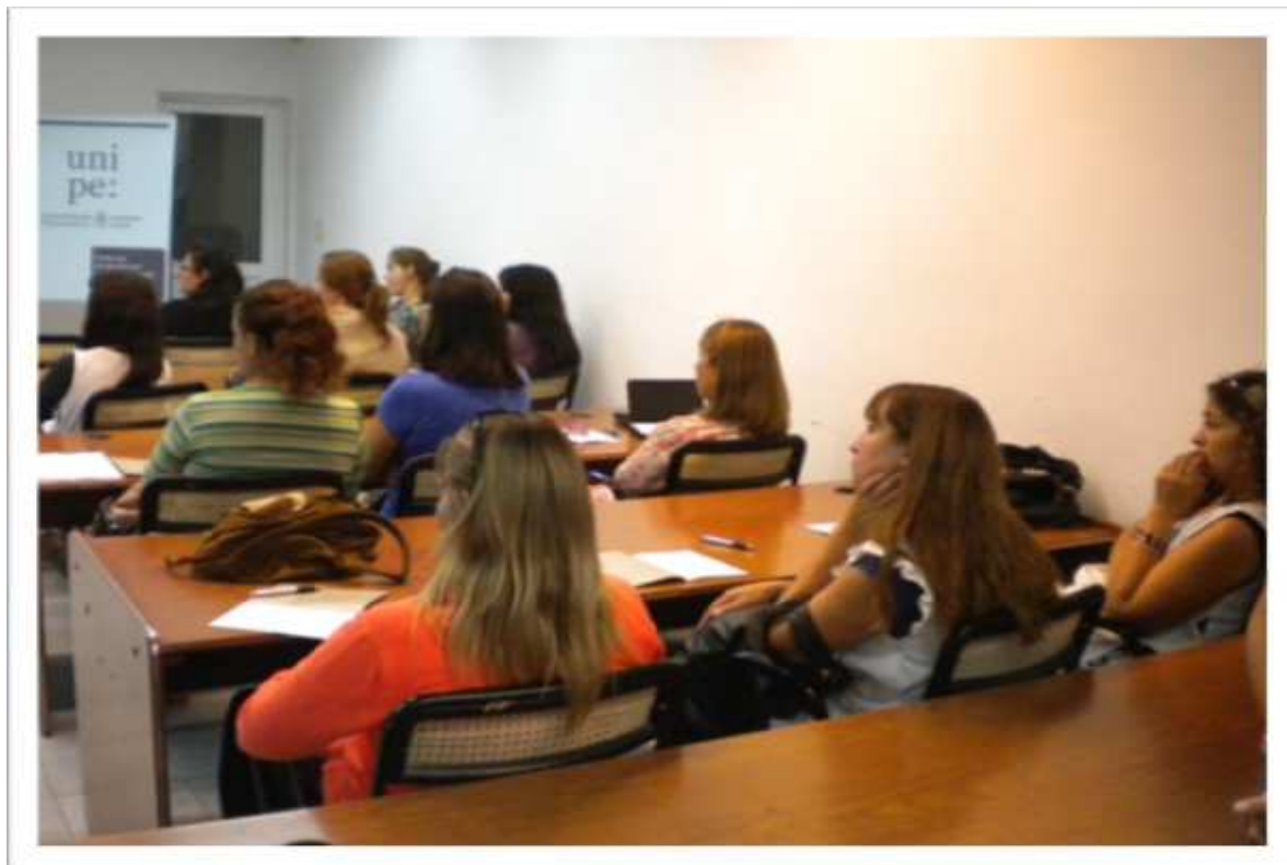
Ateneo con directivos en UNIFE, sede Del Viso, provincia de Buenos Aires.