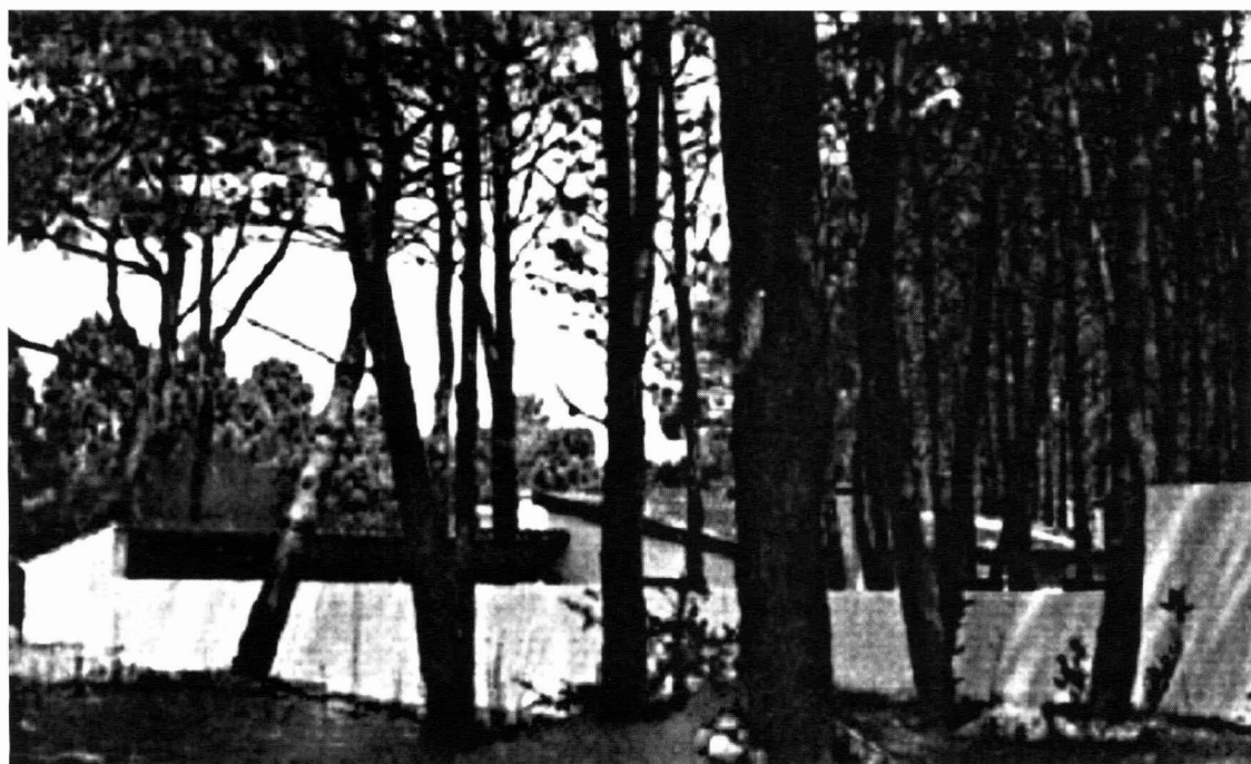
Vista y planta Exterior