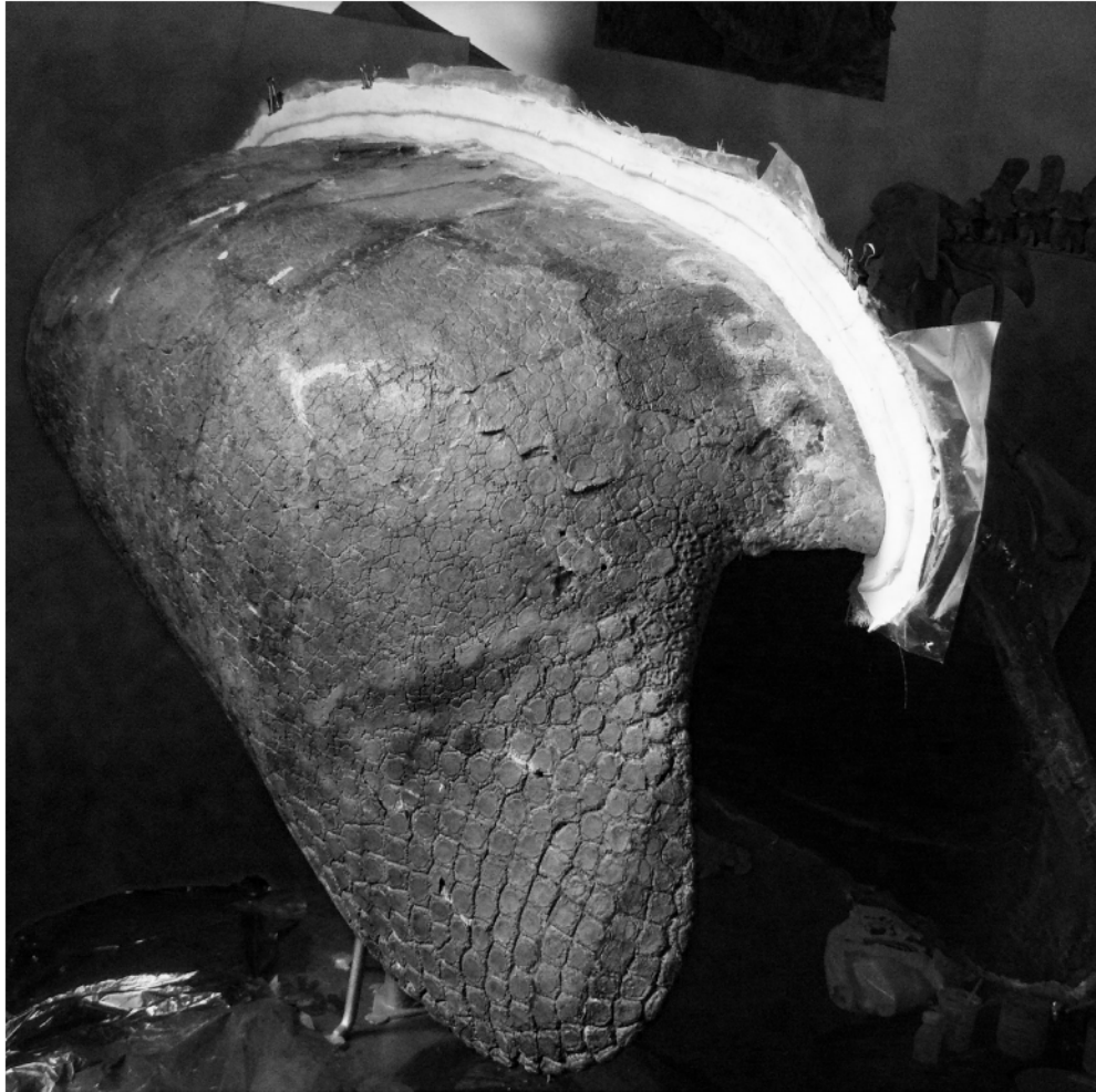
1. "Pared" divisoria de taceles.

espesor, retirando la roca o sedimento que lo rodea, pero dejando una parte como protección. Luego se traslada desde el campo hasta el laboratorio en envoltorios confeccionados con gasa y yeso. Ya en el laboratorio, se realiza la limpieza quitando los sedimentos más deleznable (blandos) mediante punzones, agujas calzadas en mangos de metal, hasta dejar el fósil a la vista. Los sedimentos más duros, en cambio, deben ser tratados tanto con pequeños martillos neumáticos (impulsados por aire comprimido), como con herramientas manuales (buriles, martillos, cortafierros, etc.). Una vez limpio el material se fortifica con lacas especiales.