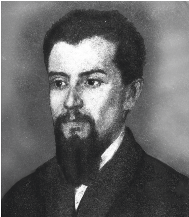
Capitán Moyano en Venecia, año 1881. Oleo de Augusto Ballerini