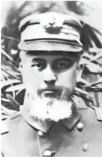
Capitán Moyano a fines del siglo XIX