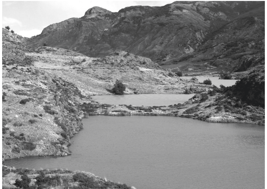
Paraje en el Lago San Martín.

Maravilló a la audiencia del Instituto Geográfico Argentino con la exposición de su cuarto viaje de exploración en la Patagonia el 7 de