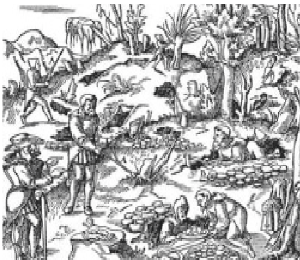
Georgius Agricola, De Re Metallica, 1556.