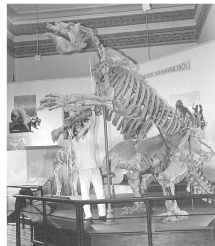
Fig. 2. Uno de los dos esqueletos de Megatherium americanum en exhibición en el Museo de La Plata.

Sus restos arribaron al Real Gabinete de Historia Natural de