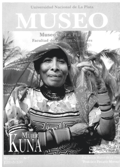
Primera tapa a todo color. Nº 7 junio 1996.

Los cuatro años siguientes -de 1995 a 1998- transcurrieron en un contexto socio-político complicado y muy desfavorable. Preocupante resultó este período de aguda crisis económica: la Fundación corrió peligro de perder su continuidad y, por