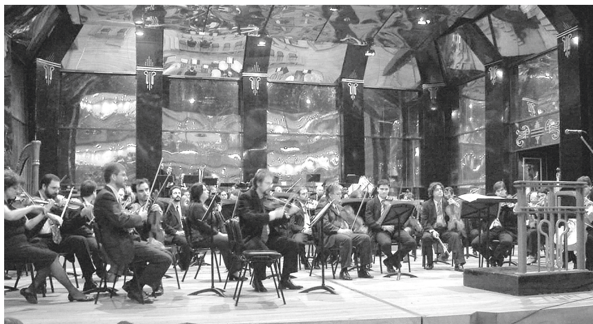
La orquesta del Teatro Argentino de La Plata.