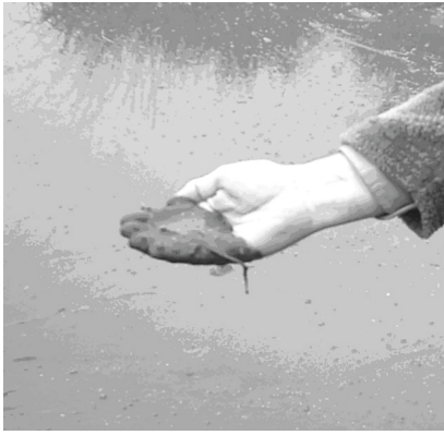
Desarrollo masivo de Microcystis aeruginosa (Pila, Buenos Aires).

toxicológicos generados por estas algas.