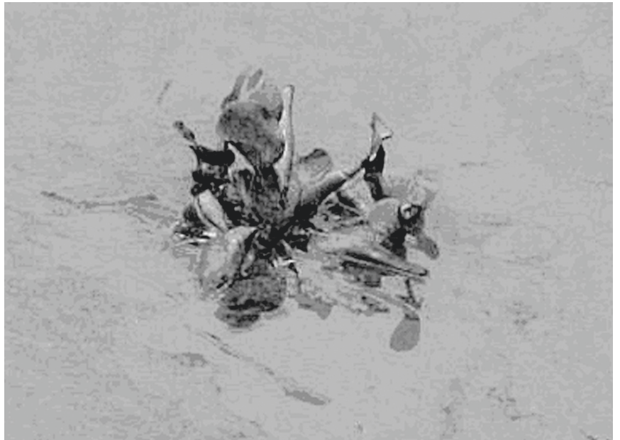
Floración de Microcystis aeruginosa en el Río de la Plata (Ensenada, Buenos Aires), junto a un camalote.

En 1984, se evalúa la mortandad de 72 vacas ocurrida en un campo de la localidad de Goyena (Buenos Aires), determinándose que las mismas habían muerto como consecuencia de la ingesta de Cyanobacteria tóxicas (Odrizola et al. , 1984). Más recientemente, en estudios llevados a cabo en el Río de la Plata, en la región de Ensenada, se detectó la presencia de microcys-