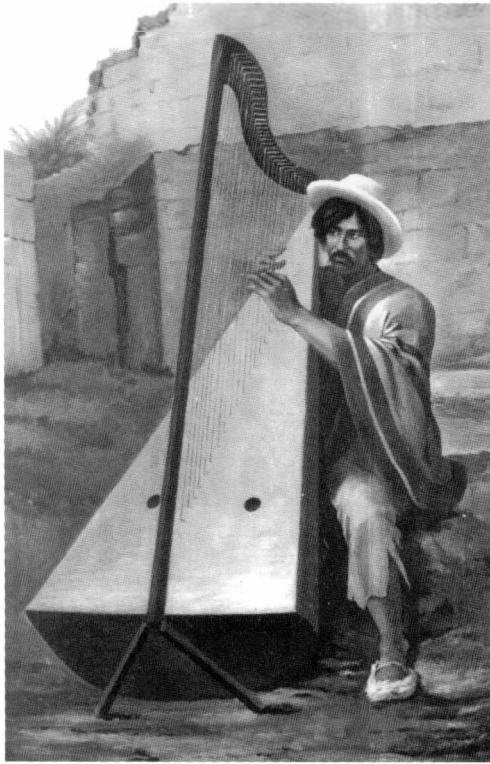
Arpista, 1888 óleo, 150 x 180 cm Charles Y. Bergès.