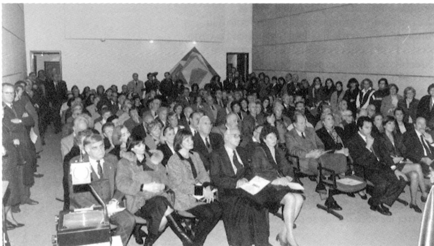
Salón Auditorio: vista de la concurrencia.

adultos, creó las "Escuelas Patrias", fundó la organización de los "boy scouts" de Argentina, renunció a su banca de diputado nacional para integrar el Consejo Nacional de Educación.