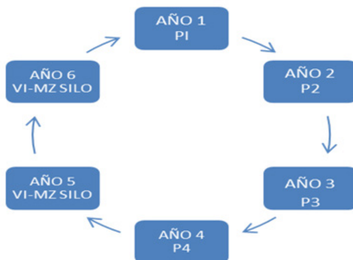
Gráfico 1. Esquemas de Rotación área VO

Rotación: en el área de VO es de 6 años: 4 años de pastura de alfalfa pura (Grupo 9) o consociada con cebadilla y trébol blanco, luego el lote va a verdeo de invierno trigo (VI-T) y Maíz de silo RR en dos oportunidades y luego vuelve a pastura siendo el maíz de silo el cultivo antecesor (años 5 y 6) (Gráfico 1). De esta manera en la plataforma de rotación tenemos 4 años de pastura y en los últimos dos años cuatro cultivos = cuatro gramíneas, indicado como óptimo para el suelo como fue informado previamente (Tamagnini, 2005.). Además, al tener dos cultivos RR y dos VI-T permiten controlar malezas antes de implantar una pastura.