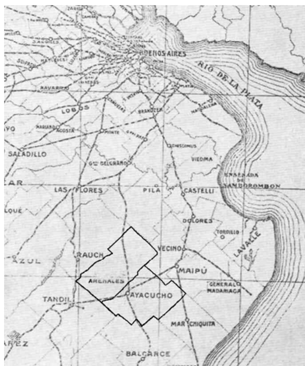
Mapa 1: Partidos de Arenales y Ayacucho, 1866