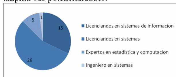
Fig. 2. Alumnados del PUI según la titulación obtenida, en etapa de finalización.

El PUI se inicia en 2013 con número de 56 inscriptos, actualmente se encuentran en la etapa de finalización, un total de 47 profesionales ( Fig. 2 ). En relación a ello, se resalta la conciencia y compromiso puestos en este Ciclo, lo que supone estar dispuesto a invertir tiempo y esfuerzo; favoreciendo ampliar sus potencialidades.