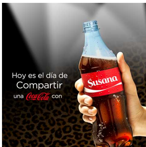
Figura 2: “Su nombre la delata como emotiva, sensible y creativa. Imprimí tu etiqueta app y compartí una Coca-Cola con todas las Susanas que conozcas”, 2015.

Se presentan algunas capturas en imágenes registradas de las campañas publicitarias de “Comparte tu Coca-Cola con” que circulan en las redes sociales. Estas panorámicas de consumo permiten observar en la superficie la uniacentualidad del signo enfático sobre las sensibilidades.