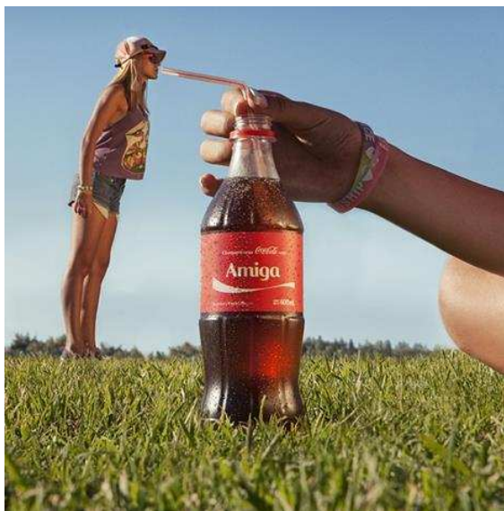
Figura 4. “Coca- Cola gigante para compartir con amigos y amigos de amigos”, 2014. Página Coca-Cola en red social Facebook.

que “delata” a sus comensales furtivos. La notoria antropo-morfización de las mercancías que se observa en la figura 2 señala un operativo simbólico mucho más profundo y perverso.