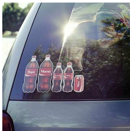
Figura 3: “Nuestra versión para que los Family stickers tengan más onda”, 2015. Fuente: Página Coca-Cola en red social Facebook.

Las operaciones ideológicas se desarrollan estableciendo y poniendo en juego siempre una interpretación. La red de significaciones se vuelve compleja y polifónica en la plataforma de una comunidad de significantes. Sin embargo, los mecanismos discursivos dominantes intentan posicionar una uniacentualidad en la transmisión de un signo ideológico que se encuentra subyacente en la significación del significante observado. La efectividad de los mecanismos de regulación de las sensaciones radica en la permanencia de ciertos sentidos que se encuentran travestidos en otros signos para su consumo “soportable”. Es interesante señalar como en la figura 1 se ordena a las prácticas de consumo apelando estratégicamente a las características y valores personales. Pareciera configurarse una omnipresencia de la industria “que todo lo ve y lo sabe” y