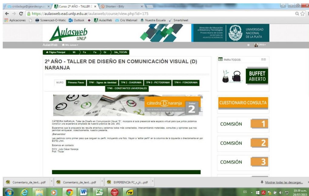
Figura 2. AulaWeb-UNLP, diseño con modificaciones. Buffet, acceso a comisiones, navegación por solapas