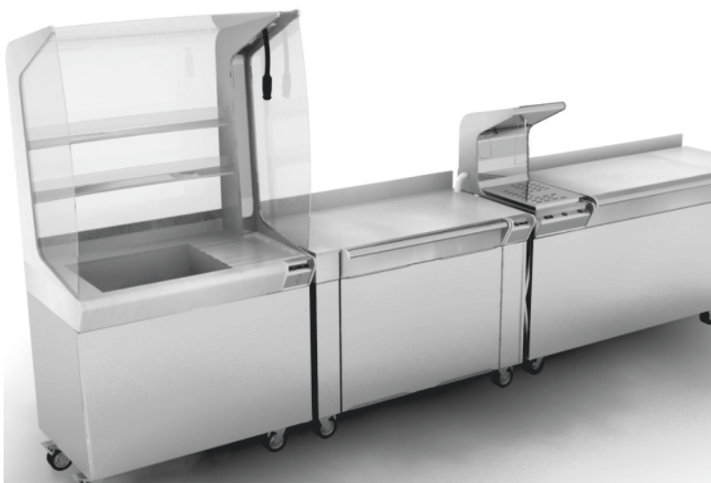
Conjunto de máquinas

Con respecto al producto, la idea fue ofrecer algo que se distinga en el mercado. Para ello, se pensó en utilizar envases de vidrio, tipo botella, que permitan la diferenciación del producto por ser artesanal, que eleven las barreras de entrada a aquellas empresas industrializadas y que posibiliten ganar un nicho en el mercado y permanecer en él. Por lo tanto, la diferenciación se basó en el diseño enriquecido del pro-