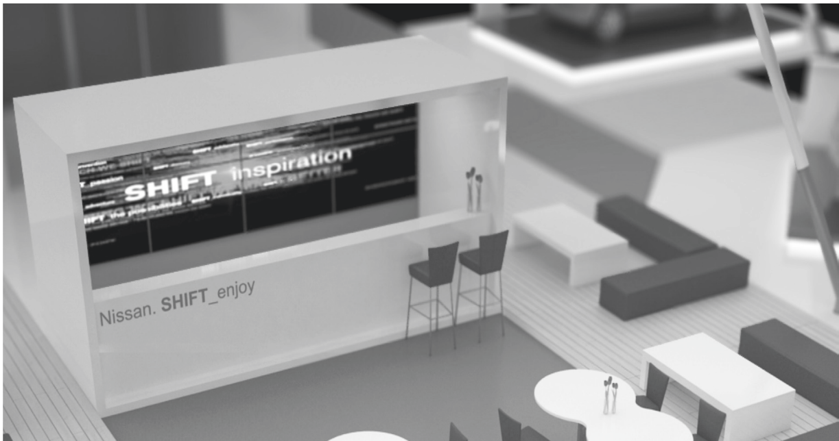
Vista interior de la zona de atención al público