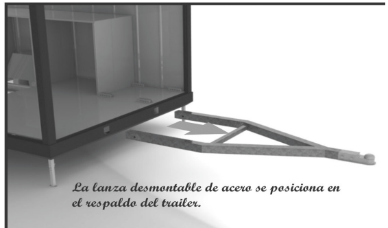
Detalles y vistas de un puesto