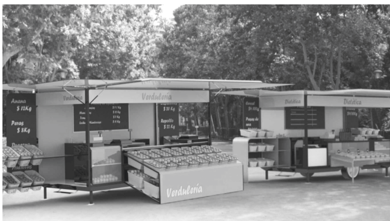
Vista de un puesto de frutas