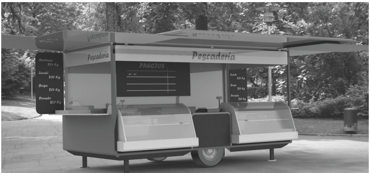
Vista de un puesto de alimentos refrigerados