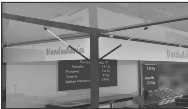
Sistemas hidráulicos de apertura