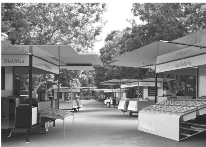
Conjunto de puestos

La propuesta de diseño está orientada a lograr una sistematización de la producción. Fue prioritaria la búsqueda de mejoras en los costos, por eso se analizaron distintas alternativas productivas y algunos ajustes morfológicos.